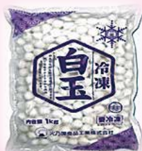
冷凍白玉小雪(s) 1kg 624円(税込)