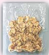
やさしい海の焼きちくわスライス 500g 892円(税込)