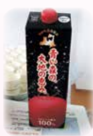
国産リンゴジュース 1L 382円(税込)