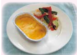
山形県産紅大豆グラタン 60g 71円(税込)