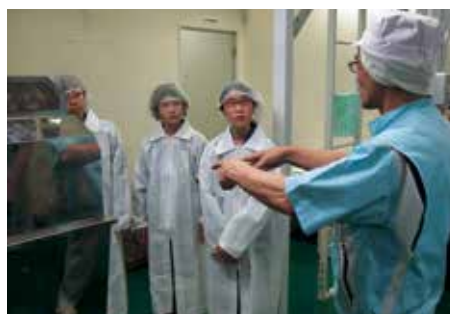
(パールライス山形)