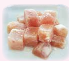
マンダイ角切澱粉付 1kg 2,242円(税込)