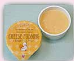
北海道チーズプリン 40g 55円(税込)