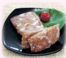
もうかざめ竜田 40g 76円/50g 89円(税込)