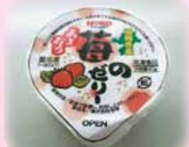
福岡県産あまおう苺ゼリー 40g 52円(税込)