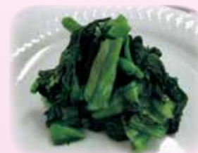
山形県産小松菜 1kg 600円(予想税込価格)