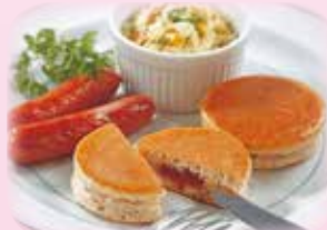
パンケーキ【個包装】 28g 36円(税込)