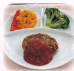
山形豚使用ハンバーグ 60g 55円(税込)