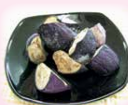
九州産カット揚げなす 1kg 1,083円(税込)