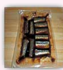
さんま洋風煮 40g 77円/50g 86円(税込)