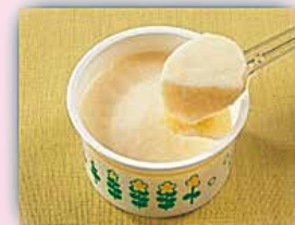
瀬戸内レモンムース 40g 52円(税込)