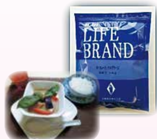
タイカレーミックス(グリーン) 1kg 1,987円(税込)