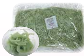
米粉めん(だだちゃ豆入り) 1kg 931円(税込)