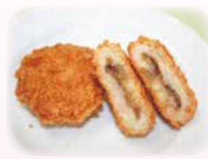
いも煮風コロッケ 40g 54円/50g 68円(税込)