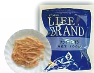
フライドごぼう 100g 664円(税込)